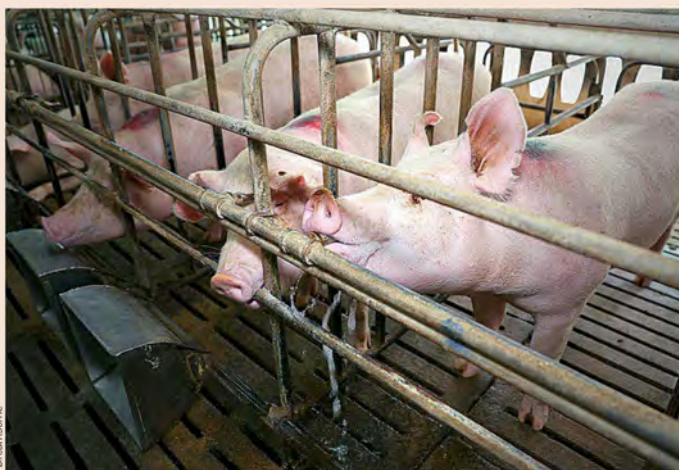
Imagen de una explotación porcina.